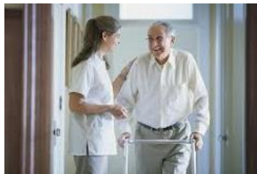
les études d'aide-soignant(e)