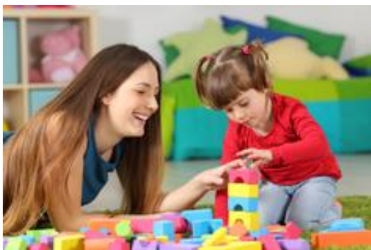
Les études d'aide-familial(e)